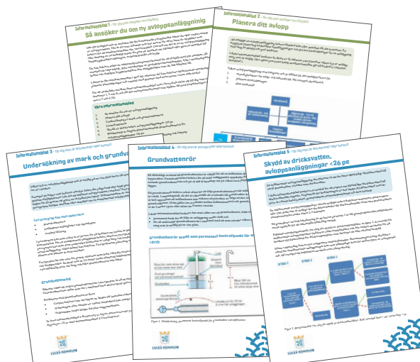
Luleå kommun har tagit fram informationsblad för att anlägga enskilt avlopp. Finns att hämta på Luleå kommuns hemsida.