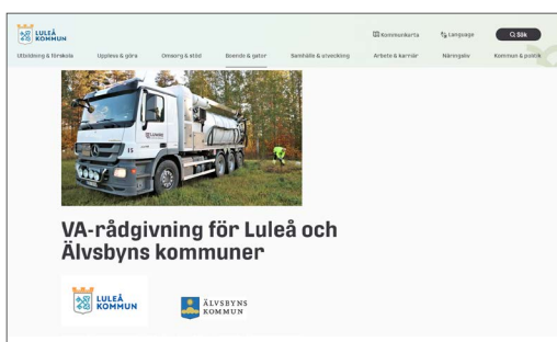
På Luleå kommuns hemsida finns information om hur du kommer i kontakt med kommunens va-rådgivare.