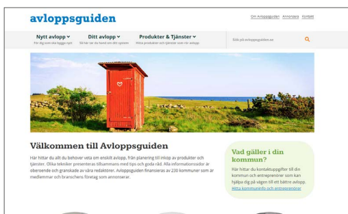
På Avloppsguidens hemsida finns samlad information om allt som rör enskilt avlopp.

Gräventreprenörer med erfarenhet och utbildning inom enskilda avlopp kan vara till stor hjälp vid planering av avloppsanläggningen och när man ska söka tillstånd.