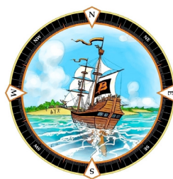
Sjösättning av biblioteksavdelningens nya organisation. Illustration: Lise-Lotte Tjernström

2015 påbörjades planering och genomförande av att biblioteken i Norrbotten ska ingå i den gemensamma nationella biblioteks katalogen Libris, samt ändra klassifikationssystem från SAB till Dewey decimalklassifikation (DDK)**. Det övergripande samarbetet styrs av länsbiblioteket och bibliotekscheferna i Norrbotten genom chefsmöten och en chefsledd styrgrupp. Utvecklingsarbetet skedde i arbetsgrupper där representanter från den regionala biblioteksverksamheten medverkade.