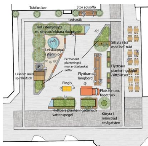
Bild 3. Alt 2 förslag utformning på sommaren.

Alternativ 2. Ny markbeläggning på utsatta körytor. Men också mer fokus på grönska, lekvärde, samt tryggt och levande. Träd, buskar, perennplanteringar, sommarblommor och belysning. Flexibel gestaltning med bord, bänkar, planteringar, mm, som är anpassad efter torgets varierade behov. Torget får en lekfull karaktär i det nordöstra hörnet.