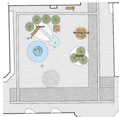
Bild 2. Alt 1 förslag utformning på vintern.

Alternativ 2. Ny markbeläggning på utsatta körytor. Men också mer fokus på grönska, lekvärde, samt tryggt och levande. Träd, buskar, perennplanteringar, sommarblommor och belysning. Flexibel gestaltning med bord, bänkar, planteringar, mm, som är anpassad efter torgets varierade behov. Torget får en lekfull karaktär i det nordöstra hörnet.