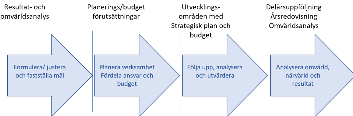
Bild 4. Processen för årlig styrning inom mandatperioden med ökat fokus på analys

De fyraåriga utvecklingsområdena skapar utrymme för analys med helt nya förutsättningar att årligen synliggöra effekten av politiska beslut. Detta utrymme medför att processen för planering, budget och uppföljning för de två efterföljande åren (2020–2021) får ett tydligare uppföljningsfokus, där resultat analyseras och används som underlag för styrning.