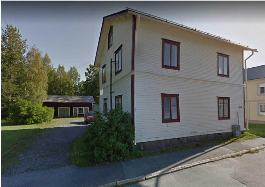
Bostadshus med garage/förrådslänga i bakgrunden